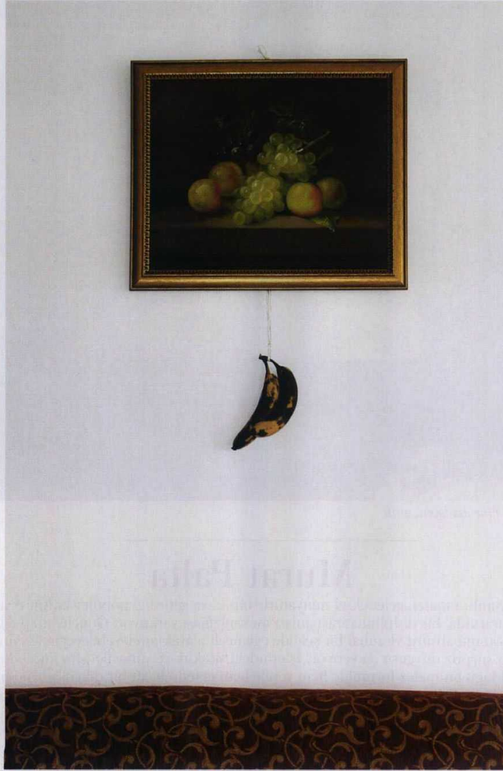
Untitled (Still Life), Arşivesel pigment baskı, 2014

Üretimlerine 'çalışma alanında sınırsızlık' başlığı atmak gerek. Zira, teknolojiyle antik çağları birleştirmek, güncelle klasik arasında bağlar kurmak ve dolayısıyla kavramsal bağlamda tehlikeli sulara gezinmek, onun oyun alanının standartlarını ve uçsuzluğunu belirliyor. Anlamlar ve anlamsızlıklar yaratmaktan heyecan duyduğunu söylüyor sanatçı ve ekliyor: "Üretimlerimin çoğu internette geçirilen zamanla ilişkili. Kültürlerin, yeni iletişim dillerinin oluşmasını ve yayılmasını takip etmekten hoşlanıyorum. Araştırma süreçlerinin ardından ortaya çıkan şeyler, kendi malzemesini kendi yaratıyor. Bir fikri aktarma yolu bazen bir tişört, bazen tahta bir çubuk, bazen de bir kahve fincanı oluyor." Sanatçının referans noktaları da çoklu; 1960'lar ve 1970'lerdeki üretim metotları ve parodilerinden sanat tarihinin estetik karşıtı söylemlerine değin, özünde her şeyden besleniyor. Berkay Tuncay, Untitled (Still Life) adlı eserinde hata, kaza ve şans kavramlarına bakıyor ve böyle bir sahneye denk gelme ihtimalinin düşüklüğünden faydalanıyor. "Hayatta neye odaklanıyorsak ona dönüşüyoruz, ironi ve mizahi yaklaşımla da hayatta başa çıkıyoruz" diyor. Sanatorium tarafından temsil edilen sanatçı, 30'lu yaşların ortalarında girift ve oyunlu işlerini üretmeye devam ediyor.