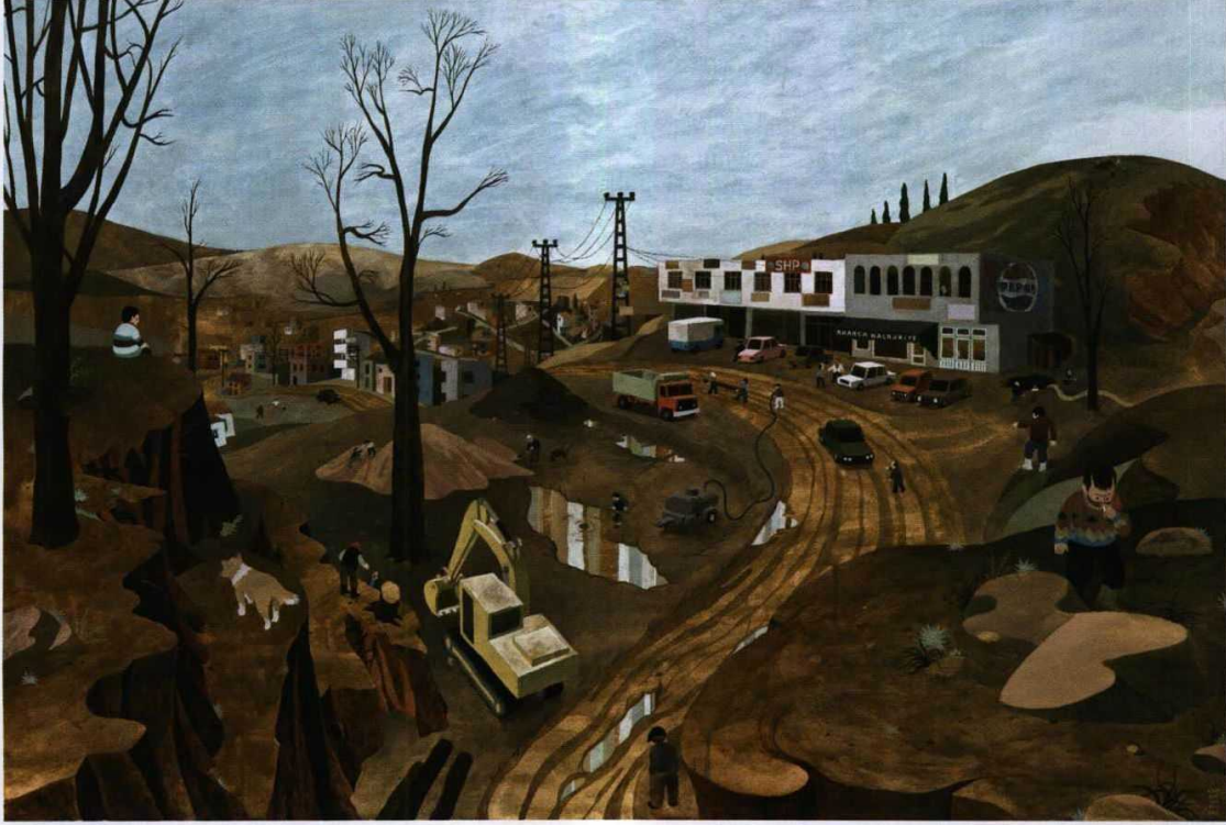
Kuruluş 1991, Tuval üstüne akrilik ve marker, 2015