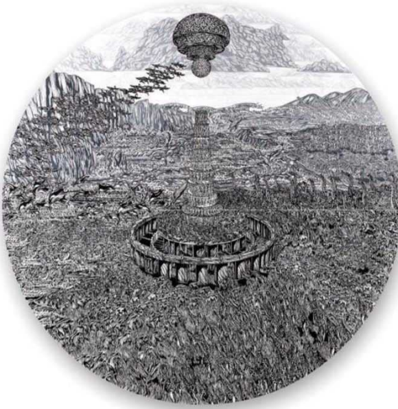
"Follow the Water IV", 2019, tuval üzerine akrilik mürekkep, 250 cm.

bakmak gerekiyor. Bence bakılacak yer, çözümün aranacağı yön çok belli; o da bilim. Doğa ve insan ilişkisi üzerine üretim yaptığınızda otomatik olarak günümüzde yaşanan büyük doğa olayları ile yakından alakadar oluyorsunuz ve bununla ilgili hassasiyetiniz artıyor. Yaşanılan durumlarla paralellik gösteren imgesel bir benzerlik, şans eseri oluştu diyebilirim.