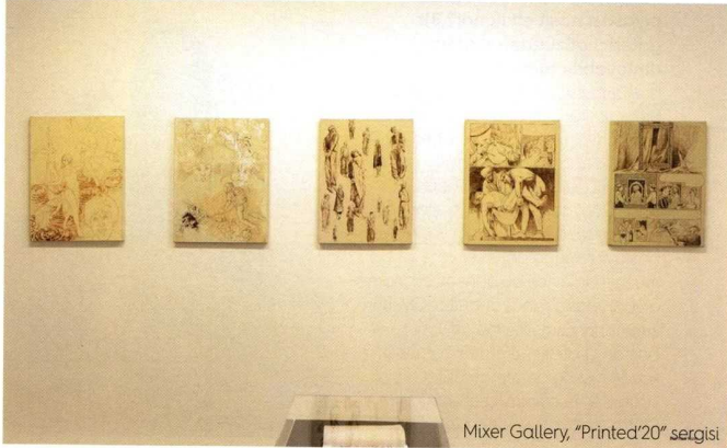
Mixer Gallery, "Printed'20" sergisi

Bir de tabii konuşmaları ve söyleşileri merakla izledim. Sanat ortamı bu anlamda da verimliydi diyebilirim.