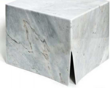
Metin Alper Kurt, Untitled, mermer, h: 30,5 x 21 x 14,5 cm, 2021

Anlamını dinginlikte arayan eserleriyle Gökhan Gökseven'in sergide isimsiz ve belirsiz hikayeler içeren bir serinin parçalarını, sessiz resimler yaratma fikri içerisinde şekillendirdiği ve kompozisyonlarının belirleyicisi olarak gizem, ürperti, kaybolan, özlem, teslimiyet, yok oluş ve sıcaklık gibi anahtar kelimelerden faydalandığını izliyoruz.