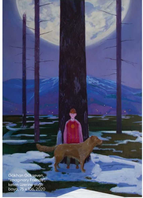
Gökhan Gökseven, "Imaginary Friends", keten üzerine yağlı boya, 75 x 106, 2020