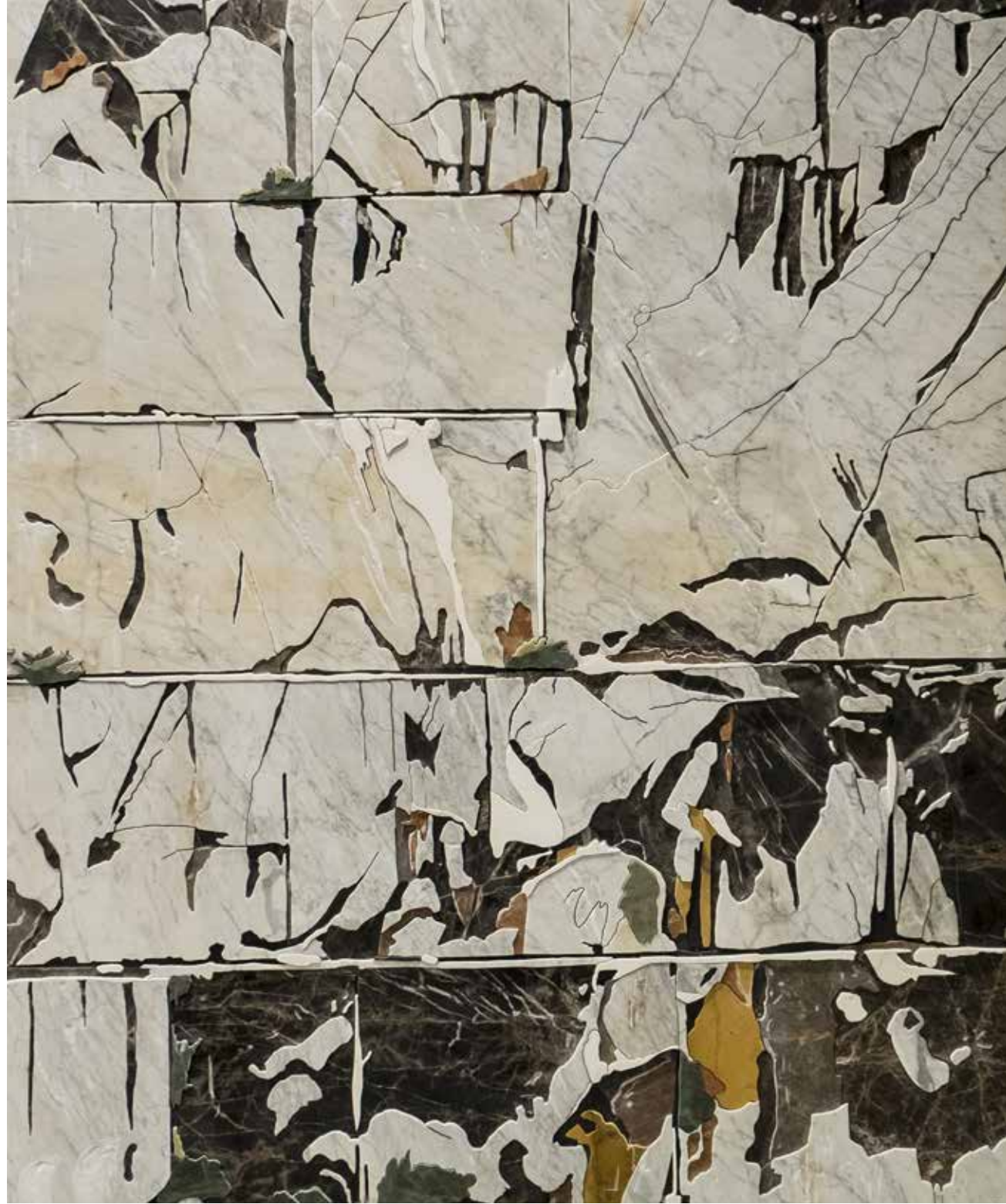
Carrara, 2014, mermer rölyef, 110x135cm,