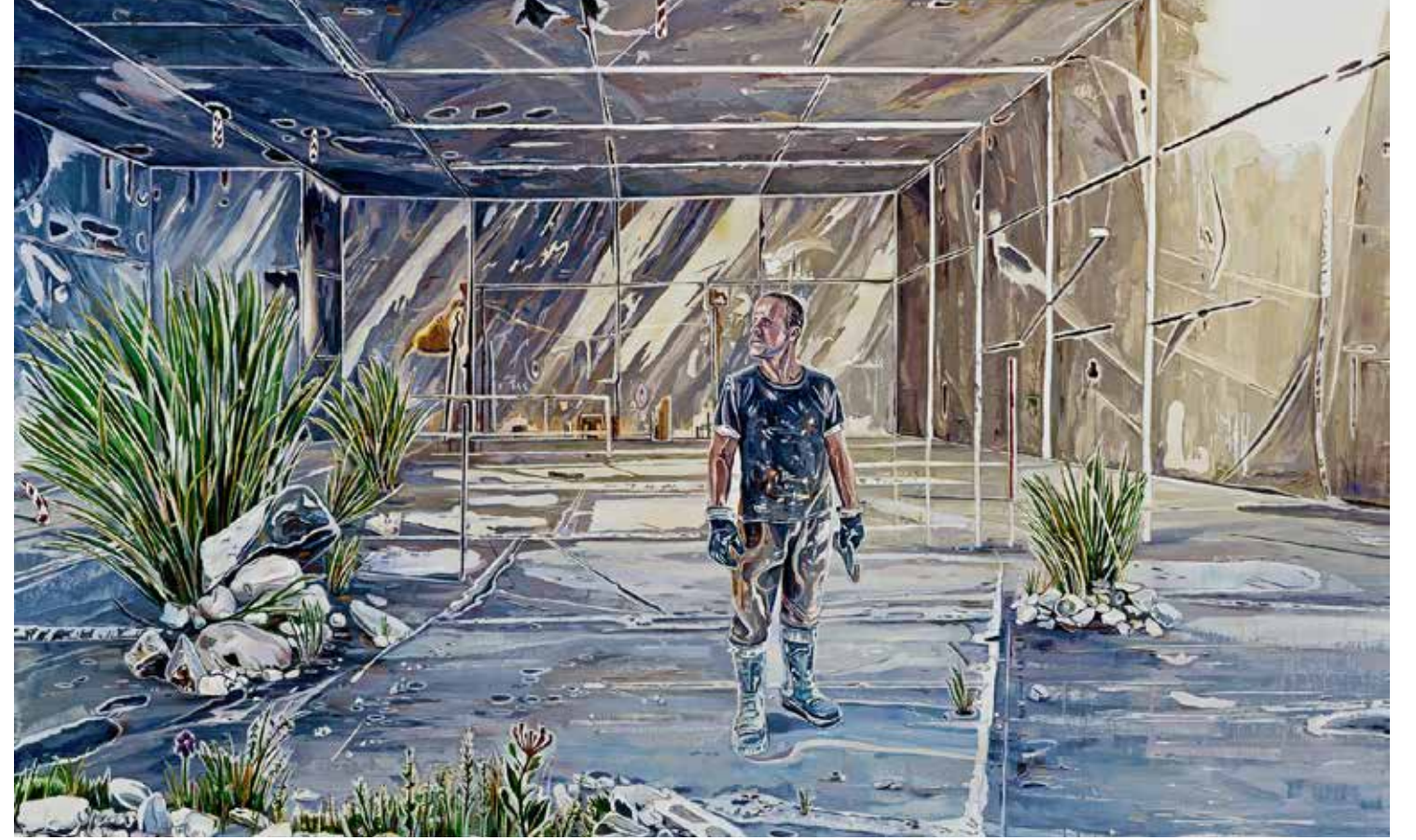
Dönüşüm alanı, 160x240cm, tuval üzerine yağlı boya, 2015

rek bu taşları topluyorum. Seçtiğim taşların çoğu mermer oluyor, bazen granit, traverten gibi başka doğal taşlar da işime dahil olabiliyor. Mümkün olduğunca, bu bölgelerde bulduğum atık taşları kullanmaya çalışıyorum.