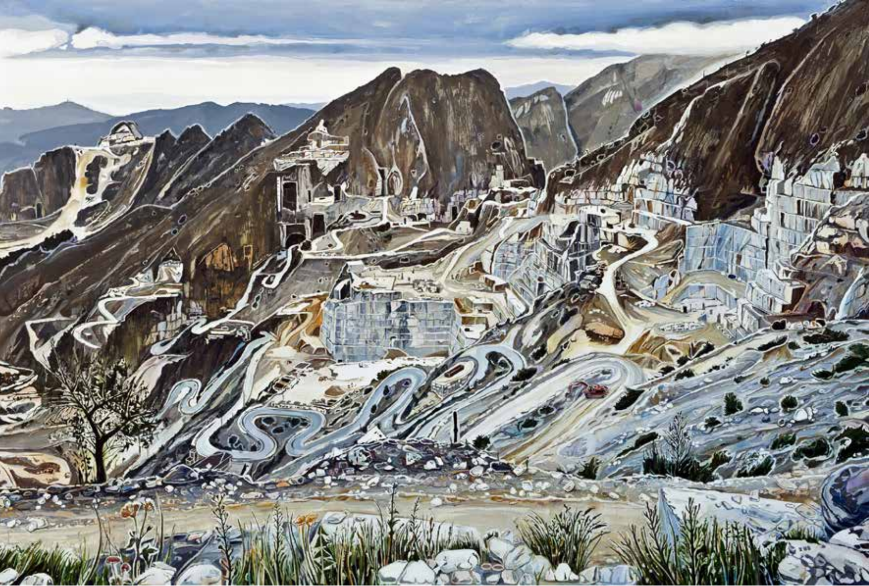
Tepeden Bakış, 175x250cm, tuval üzerine yağlıboya, 2015

ve teknik arayışlarıma cevap veriyor. Konunun beraberinde getirdiği görsellik, önce resimlerime geometrik ve heykelsi formlar ekledi. Daha sonra, maddeyi, malzemeyi özümsemeye ihtiyacı duyarak, malzemenin doğrudan kendisini kullandığım işler üretmeye başladım. Doğal taş ve mermerleri kesip, kolaj mantığıyla oluşturduğum üç boyutlu işler ortaya çıktı.