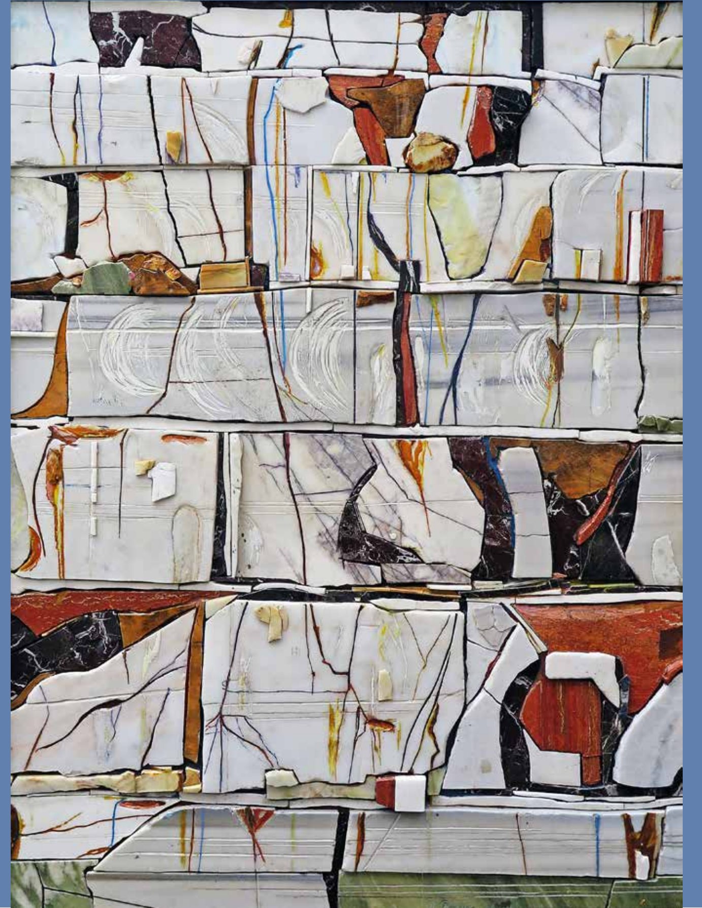
Bakış, 2014, mermer rölyef, 220x165cm

First of all, i decide the colors of the stones for my sketches. I am collecting these stones by visiting many marble manufacturers in İstanbul and