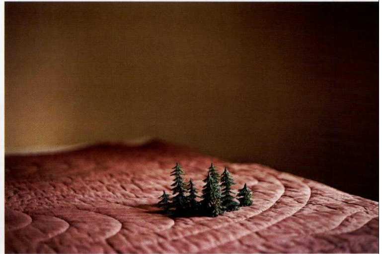
Small Forest , Anni Leppälä, 2014.