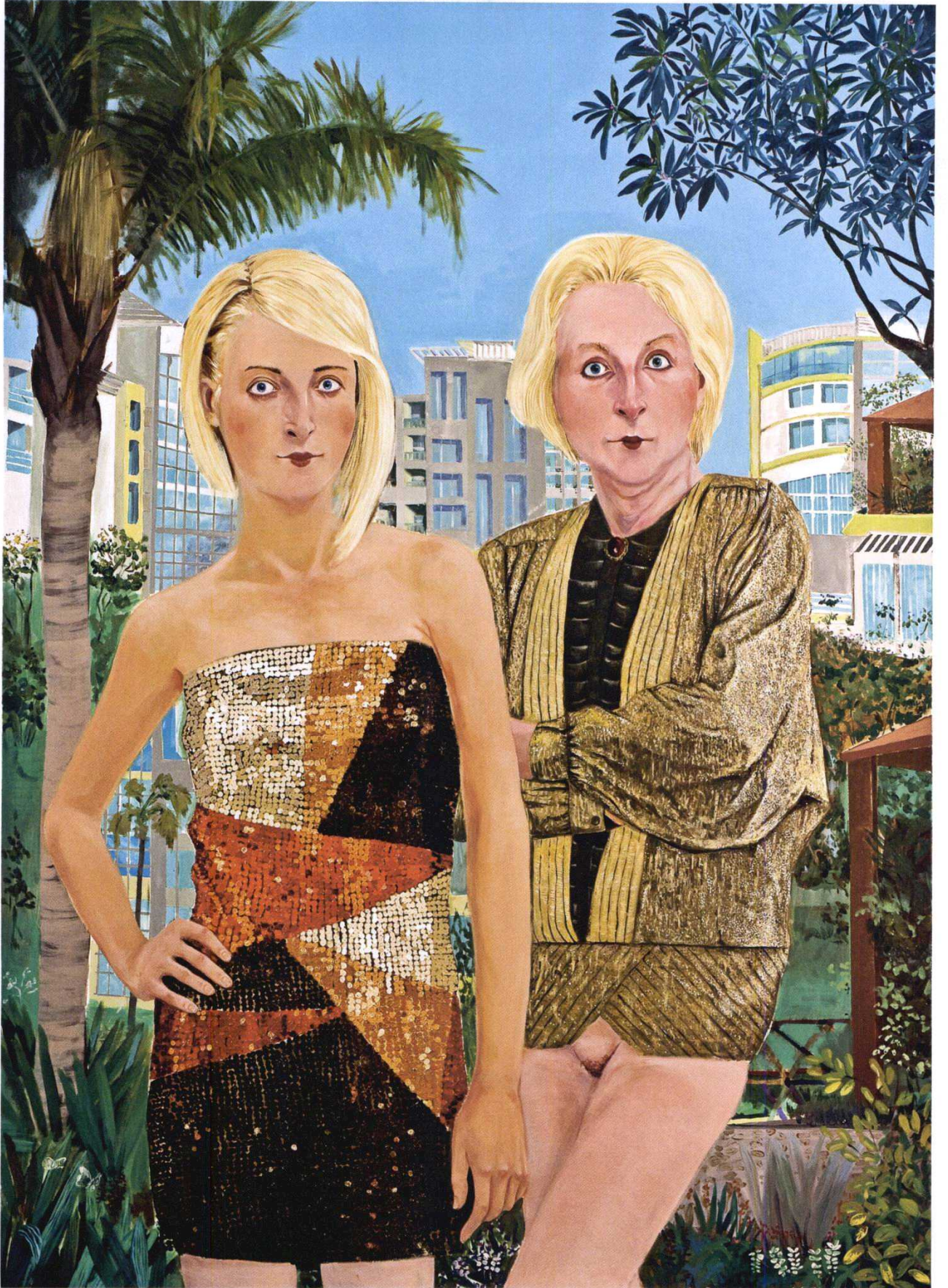
MİRAS BABADAN OĞULA GEÇER I, TUVAL ÜZERİNE YAĞLIBOYA, 190x140, 2011