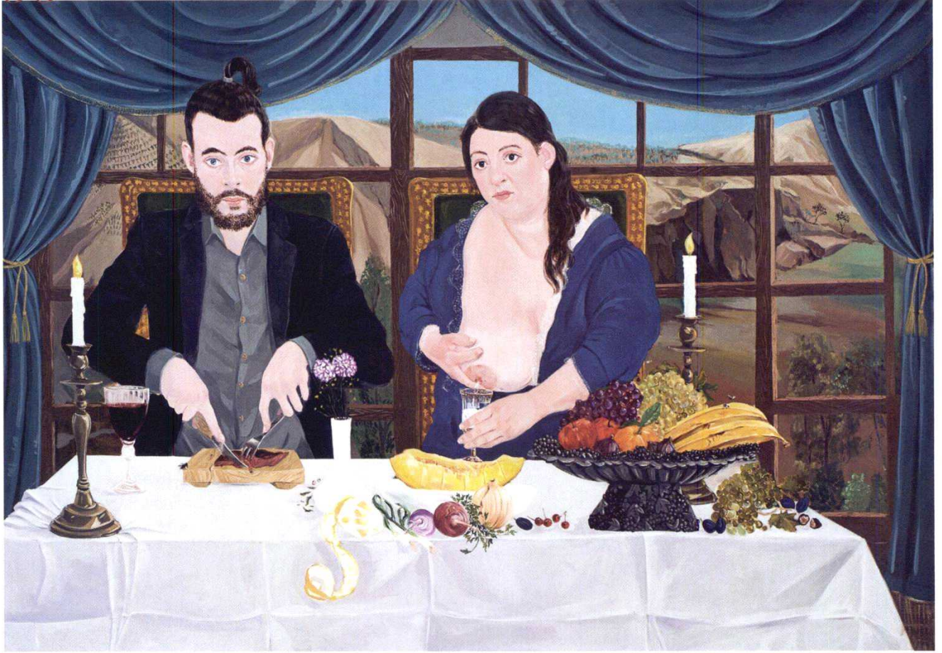
YEMEK YEMEK I, TUVAL ÜZERİNE YAĞLIBOYA, 145x210, 2011

Çalışmalarınızı kısaca nasıl tanımlarsınız? Renkli, içinde şiddetin ve cinayetin eksik olmadığı, her daim absürlükler barındıran, mizahı da eksik olmayan bir ana haber bülteni olarak tanımlayabilirim.